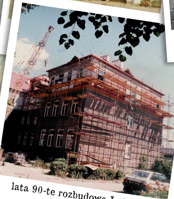
lata 90-te rozbudowa I etap